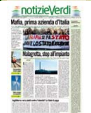
Numero 207 12 Novembre 2008